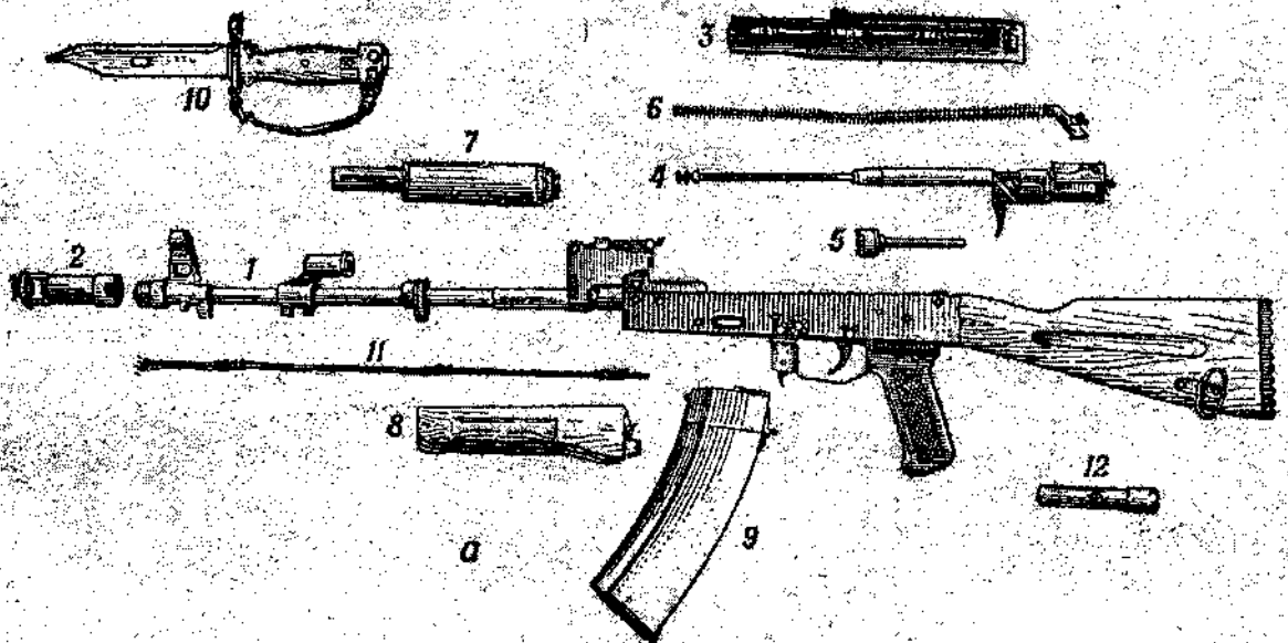
Рисунок 2 - Схема механизмов винтовки MP-512

1 - ствол со ствольной коробкой, прицельным приспособлением, прикладом и пистолетной рукояткой; 2 - дульный тормоз-компенсатор, 3 - крышка ствольной коробки; 4 - затворная рама с газовым поршнем; 5 - затвор; 6 - возвратный механизм; 7 - газовая трубка со ствольной накладкой; 8 - цевьё; 9 - магазин; 10 - штык-нож; 11 - шомпол; 12 - пенал